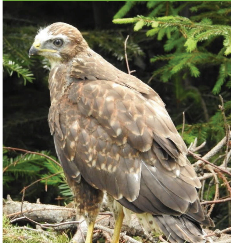
Șorecar comun – Buteo buteo

De cele mai multe ori, să îngrijești un pui necesită foarte multă pricepere, timp și resurse adecvate. În primul rând, el trebuie hrănit o dată la două ore. În cazul unui mamifer, laptele trebuie să aibă o anumită compoziție, cât mai apropiată de cel al speciei, iar pentru păsări un aport constant și des de insecte. Dar, dacă totuși se întâmplă să găsești un animal care are nevoie de ajutor, pui sau adult, și esti sigur că sănătatea ta nu este în pericol, atunci îl poți lua și transporta într-o cutie de carton închisă, cu găuri (cutia va trebuie să fie de dimensiuni apropiate cu ale individului). Eventual, el poate fi înfășurat într-un prosop sau într-o cârpă, în cazul unui animal mai agitat, pentru a se evita rănirea.