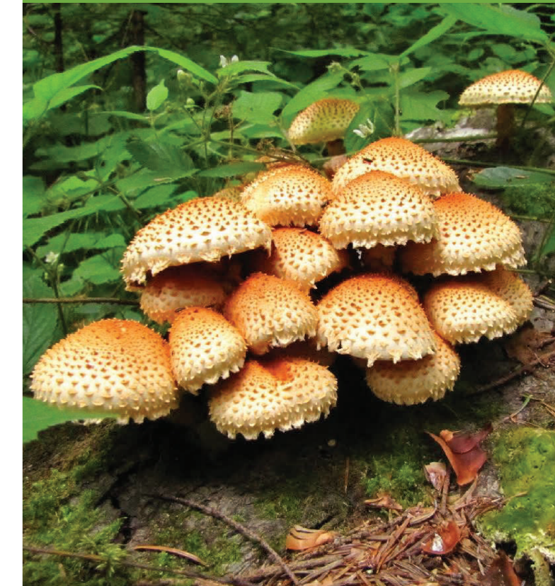
Ghebe de rădăcină – Armillaria mellea

După cum am amintit și mai sus, seamănă cu ciuperca albă, dar la maturitate, ajunge la dimensiuni mai reduse (pălăria are 3-10 cm diametru, piciorul 3-10 cm înălțime). Pălăria este albă, mătăsoasă, rar cu scame brune. Inițial, pălăria este sferică, apoi crește și se întinde. Regiunea himenială este, și aceasta,