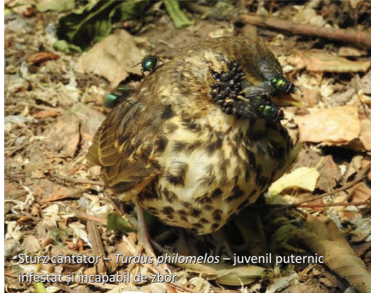
Sturz cântător – Turdus philomelos – juvenil puternic infestat și incapabil de zbor