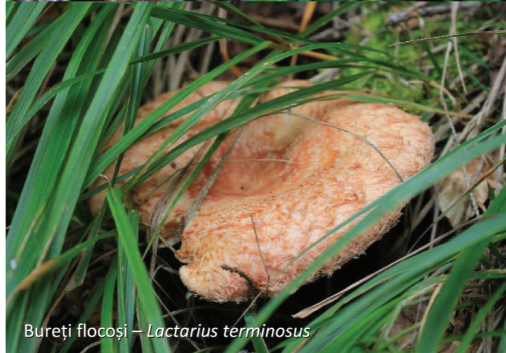
Bureți flocoși – Lactarius torminosus