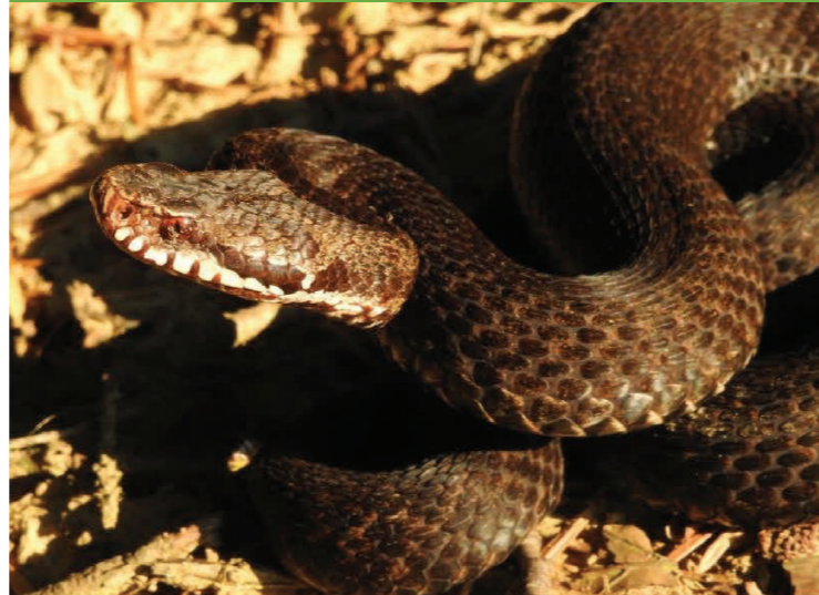
Vipera de munte – Vipera berus

Vorbind tot de reptile, multe țestoase ajung să fie capturare din mediul lor natural și ținute în curte, în terarii sau în acvarii mărunte, cu deficiențe mari privind igiena sau hrana. Deși nu apar în zona Valea Ierii, ele pot fi întâlnite în zone mai joase, umede chiar din județul Cluj. Altă problemă, și de data această și mai gravă decât prima, care poate avea impact negativ semnificativ asupra distribuției speciilor, putând duce la extincția locală a unora dintre ele, este eliberarea țestoaselor cumpărate din petshop-uri , de cele mai multe ori fiind vorba de specii alohtone (care nu se găsesc pe teritoriul României). Ca sfaturi generale, nu lua din mediul său natural nicio specie, nu doar țestoase, iar dacă le-ai cumpărat și nu ești sigur de specia din care fac parte sau de starea lor de sănătate, nu le elibera în natură. În aceeași