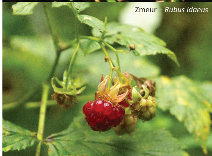
Zmeur – Rubus idaeus