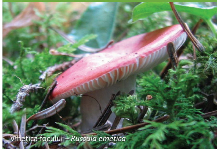
Vinețica focului – Russula emetica

Pălăria și piciorul au o culoare roz-cărămizie, portocalie. Ca diferență, partea dorsală (de deasupra) a pălăriei prezintă zone concentrice mai închise la culoare și peri lungi. Regiunea himenială este și aceasta lamelară. Lamelele sunt subțiri și coboară ușor pe picior. Dimensiuni: pălăria are diametrul 4-12 cm, piciorul o înălțime de 4-8 cm.