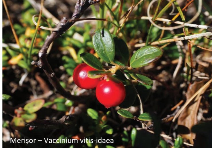
Merișor – Vaccinium vitis-idaea