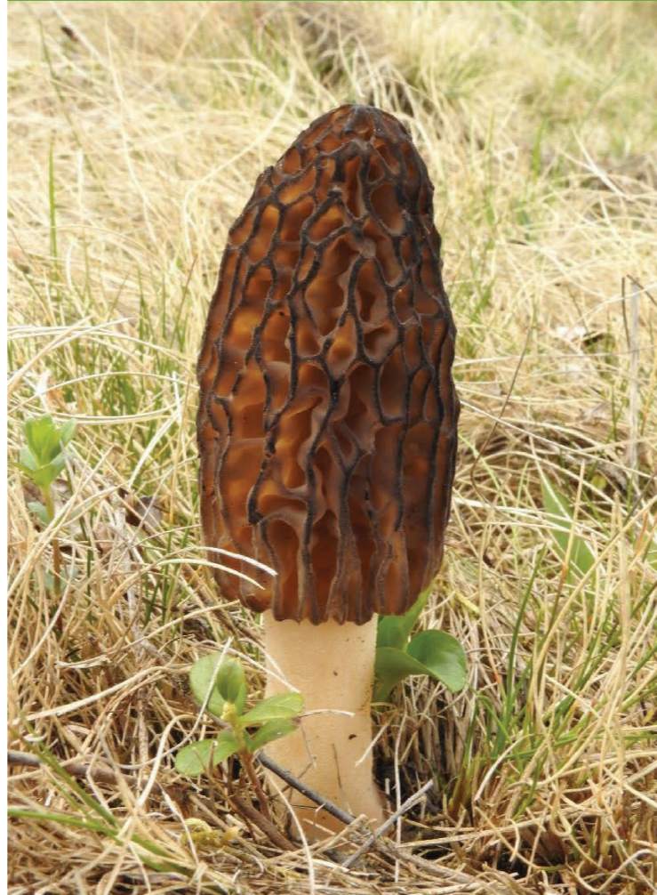
Zbârciog – Morchella esculenta

Crește din vară până toamna, în păduri de conifere. Apare pe sol și este comestibilă.