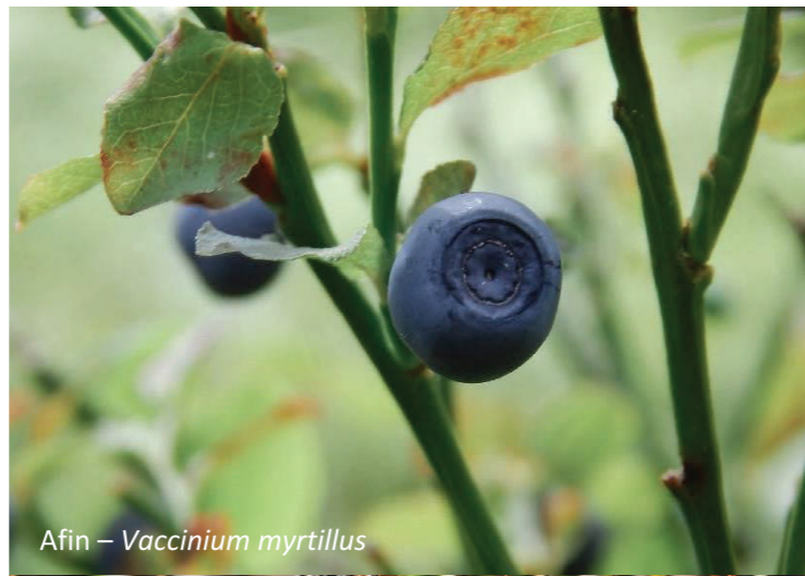
Afin – Vaccinium myrtillus

Este un arbust înalt, de 0,5 – 2 metri înălțime, peren, cu tulpini bianuale. În primul an, planta crește de obicei în înălțime cu tulpinile principale. În al doilea an, planta își dezvoltă ramuri secundare care prezintă frunze compuse cu 3-5 frunzulițe. Florile sunt produse primăvara târziu, în raceme scurte în vârful ramurilor secundare. Fructele sunt comestibile, având culoarea roșie, cu 2-6 drupeole (fructe mici, individuale). Apar în principal vara. În această perioadă, planta poate fi considerată ca o importantă bază trofică pentru urs.