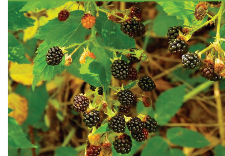
Mur – Rubus caesius

Apare din zona de câmpie până în zona molidului, în pajiști, rariști de pădure și pădure, dar și tufărișuri.