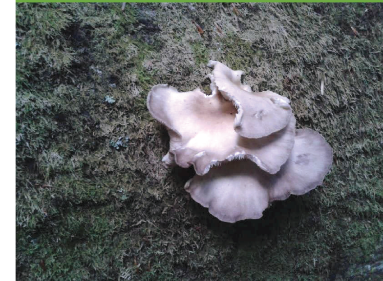
Burete negru – Pleurotus ostreatus

Pălăria are culoarea roz-roșiatic, mov sau chiar marou, inițial sferică, devenind apoi mai întinsă, cu interiorul concav. Are un diametru de 6-10 cm, la maturitate. Zona himenială este lamelară, de culoare