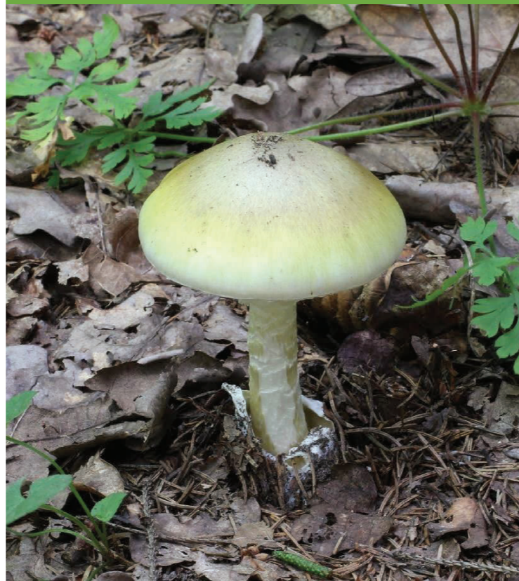
Buretele viperei – Amanita phalloides

Crește pe sol, în păduri de foioase și conifere, în zone răcoroase, cu umbră și umezeală. Specia este posibil cea mai toxică din România, iar consumul acesteia provoacă sindromul faloidian, cu decesul persoanei în 1-5 zile, în funcție de cantitatea consumată.