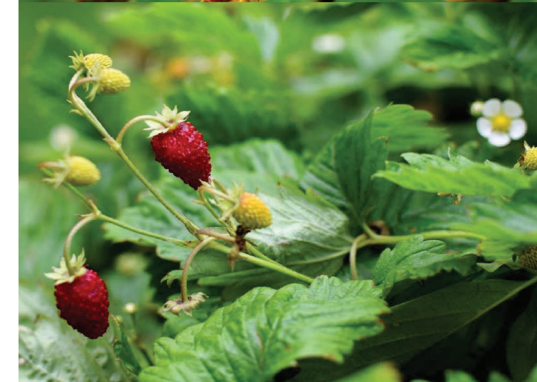
Frăguțe – Fragaria vesca