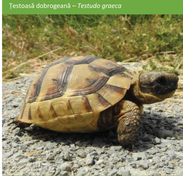
Țestoasă dobrogeană – Testudo graeca