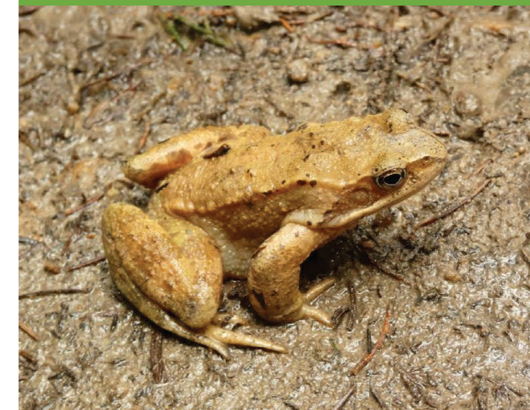
Broască roșie de munte – Rana dalmatina